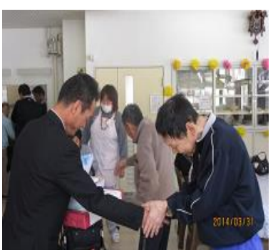
前施設長とがっちり握手

六月二十八日、更望園三十周年祝賀会を行います。会場は、園内の体育館を予定しております。詳細については、園内に貼られています。皆様のご参加をお待ちしております。