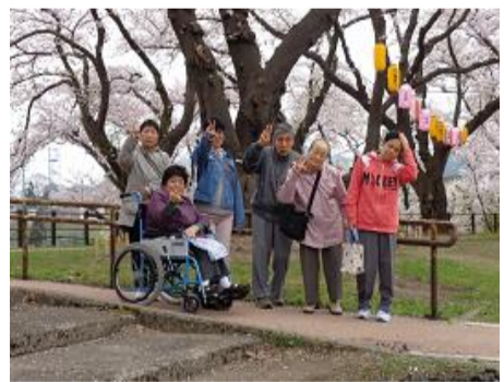
桂城公園にて記念撮影

四月十九日、春の桜が満開になり、園内も春気味です。ご利用者の皆様も、桜を楽しんでいます。園内には、桜の木が植えられており、これからますます花が咲いていきます。皆様と一緒に桜を楽しみたいと思います。