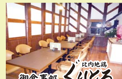
御食事処 くらみせ 鹿角市花輪字上花輪 139 番地 1 TEL 0186-25-8828