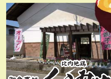
御食事処 くらみせ 鹿角市十和田毛馬内字毛馬内 62-1 TEL 0186-25-8262