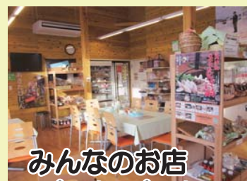
みんなのお店 わいわい 小坂町小坂鉦山字栗平23-1 TEL 0186-29-2061